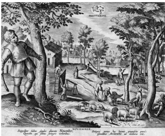
Calendrier populaire: juin et novembre